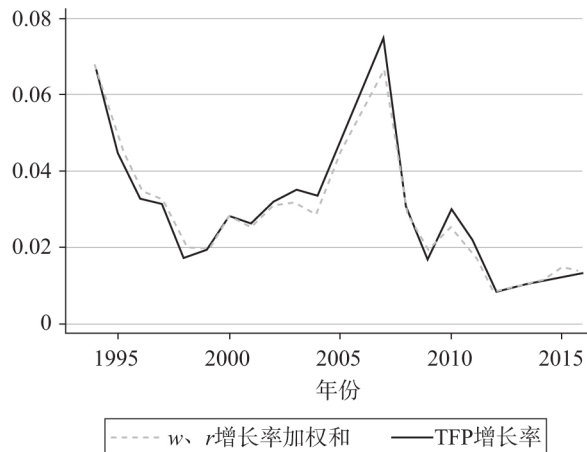
图3 TFP增长率与 w 、 r 增长率加权和变化趋势对比

尽管我们计算 w 、 r 的增长率加权和时使用了每年都有所变化的利润和工资份额，但从图3可知， w 、 r 的增长率加权和仍然和TFP保持了比较一致的趋势。所以，在契合收入恒等式的情况下计算的TFP增长率是实际分配关系的函数。与前面一样，估计得到的参数仍然可以视为分割收入的比例，但这次估计是为了使分割收入而得到的对数加权和符合实际的工资率与利润率的对数加权和 \ln B_t 。因此，估计得到的资本产出弹性恰好等于资本收入份额，并不代表证明了边际生产力条件，而是因为回归方程中加入的余项恰好符合工资率与利润率以利润和工资份额为权重的对数加权和。